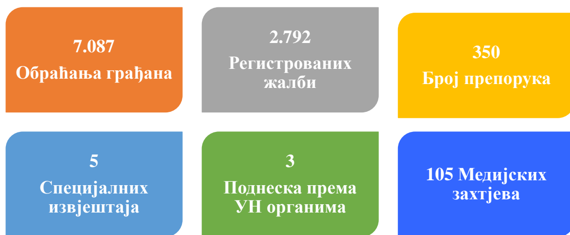
Графикон 1. Преглед основних индикатора везаних за рад Институције

Током 2024. године Институција омбудсмена запримила је укупно 2.792 жалбе. У 2024. години укупно је архивирано 2.690 предмета, од тога 1.704 предмета из 2024. године и 986 предмета из претходних година. Током извјештајног периода Институцији омбудсмена укупно се обратило 7.087 грађана (директни контакти, писмени контакт, телефонски позиви, електронска пошта и писане жалбе). У графикону 2 дат је приказ обраћања грађана Омбудсменима БиХ у 2024. години.